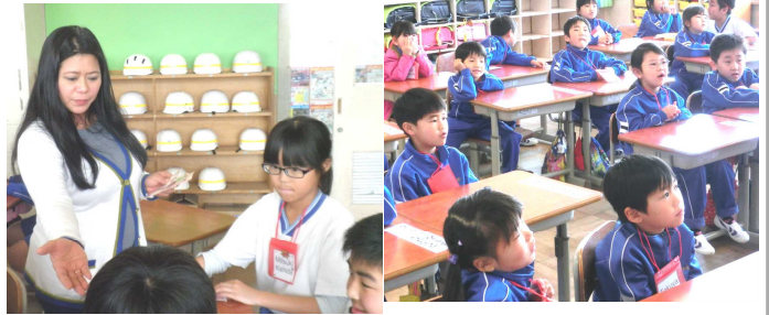
1年生とポビー先生 ↑ ↓